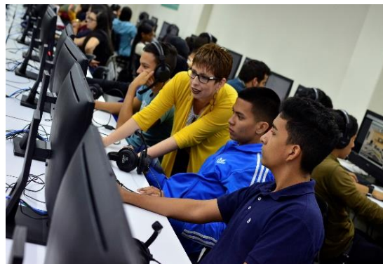
Laboratorio de Idiomas